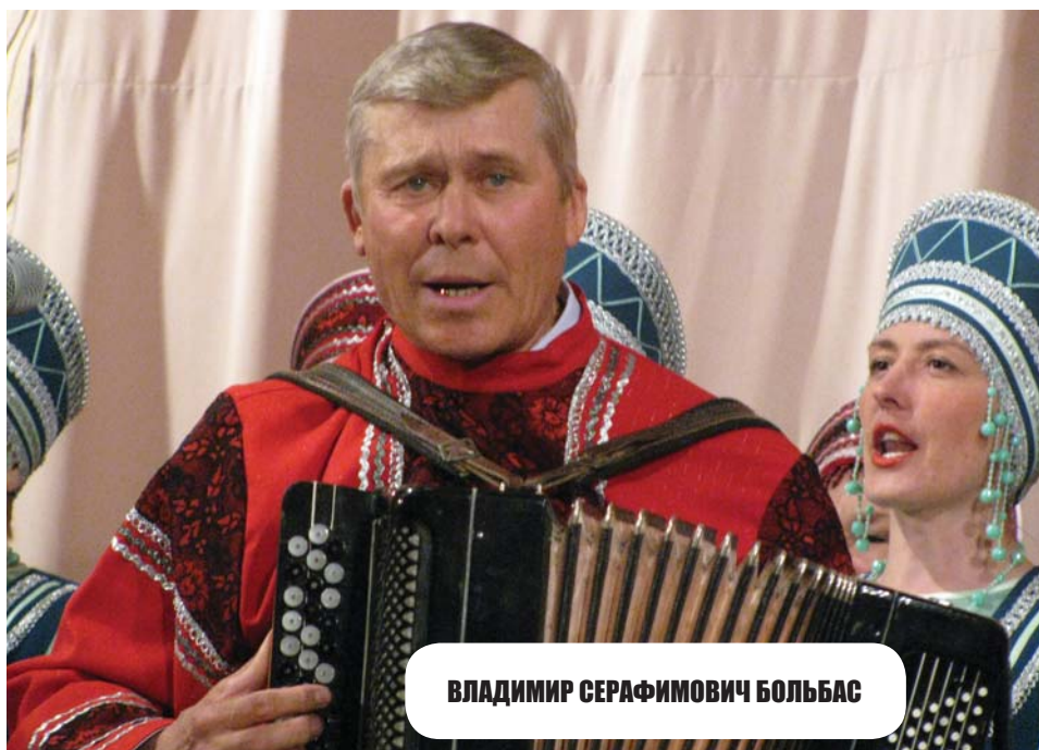
ВЛАДИМИР СЕРАФИМОВИЧ БОЛЬБАС