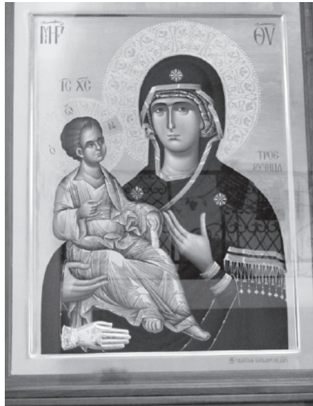
Праздник в Колпашево.

5 сентября в кафедральный Вознесенский собор в г. Колпашево, пребывала икона Богородицы Троиручицы с горы Афон. Святой образ встречал Епископ Силуан с сонмом духовенства и верующих Православных христиан.