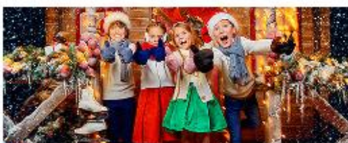
Проведение мероприятий и праздников