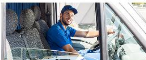
Услуги по перевозке пассажиров и грузов