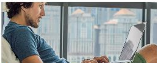
Удаленная работа через электронные площадки

Вот несколько примеров, когда налогоплательщикам (самозанятым) подойдет специальный налоговый режим.