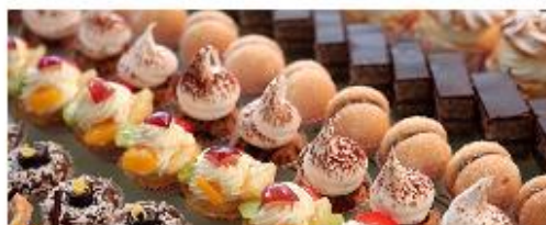
Продажа продукции собственного производства