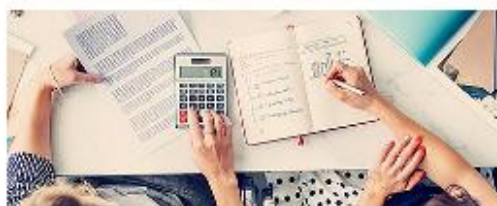
Юридические консультации и ведение бухгалтерии