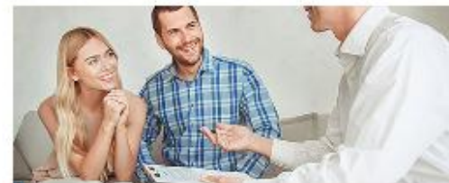
Сдача квартиры в аренду посуточно или на долгий срок