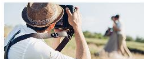
Фото- и видеосъемка на заказ