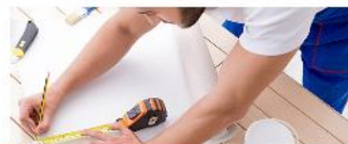
Строительные работы и ремонт помещений

Налог на профессиональный доход можно платить и при осуществлении других видов деятельности, если соблюдаются все условия, предусмотренные Федеральным законом от 27.11.2018 № 422-ФЗ.