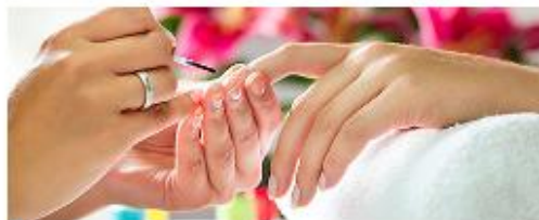
Оказание косметических услуг на дому